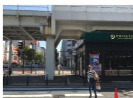
線路の下をくり直進