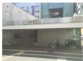
③地下街を使うと便利