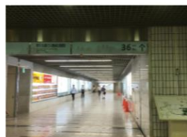
36番出口から地上へ ⑤につながる