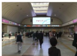
大ビジョン下の階段を降り