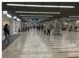
地下道を最奥まで直進