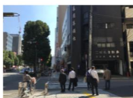
⑥亀屋葬儀社の信号を右折