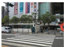
④地下街を通らない場合 “ルフロン”前を左折