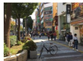
⑤地下道を通った 場合の出口付近